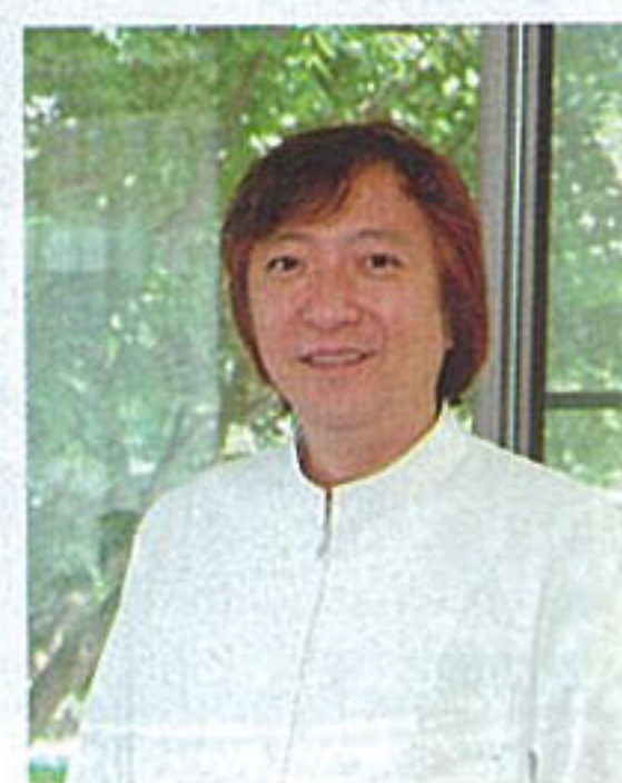
教えてくれた先生