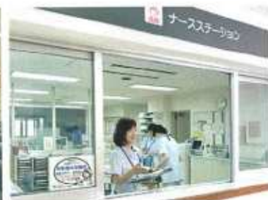
ナースステーション