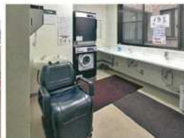
コインランドリー／洗面・洗髪室